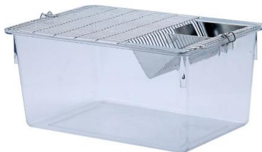
Jaulas para Ratones y Ratas con tapa filtro en Polisulfonato y Policarbonato